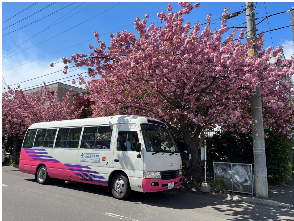
八重桜で有名な南4条通りを中心に桜ドライブに出かけます♪