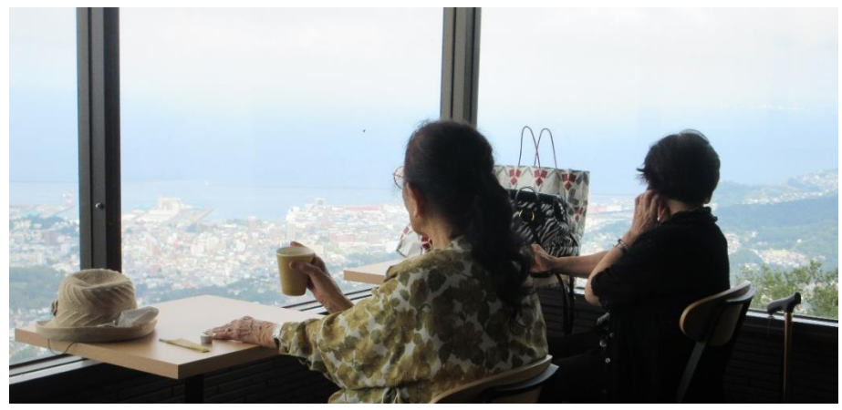
展望台から小樽市街を一望できます

負担割合が記された介護負担割合証がご自宅へ届きます。皆様の負担割合確認のため、控えを撮らせて頂きたい、「えん」ご利用時に受付へ提示お願いいたします。 コピー後、お返しいたします。ご協力の程、何卒宜しくお願い申し上げます。