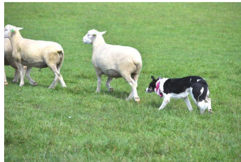
たくさんの羊たちに会えます