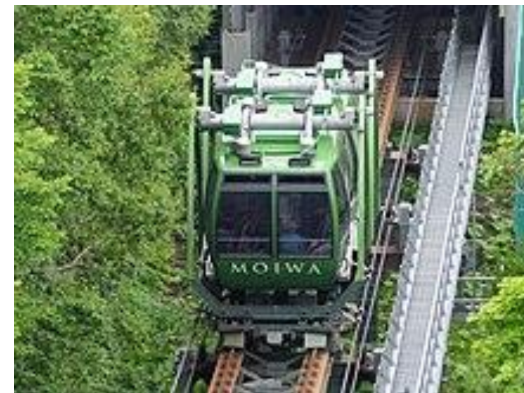
展望台へ移動するケーブルカー