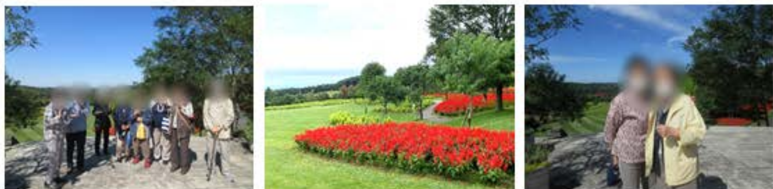
お腹いっぱいランチピュッフェを食べ、真っ赤なサルビアが綺麗に咲いた庭園を楽しみました。