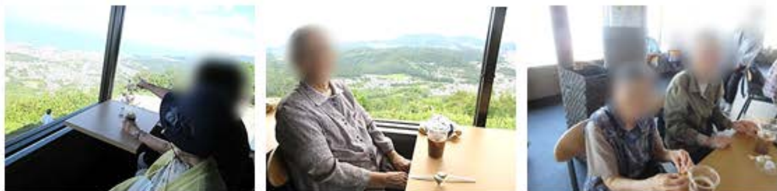
天狗山から小樽の景色を眺め、新南樽市場でお買い物を楽しみました。