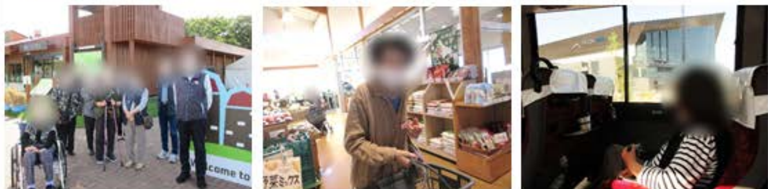
くるるの杜でお買い物と、来春オープンする日本ハムファイターズ新球場のエスコンフィールド北海道までドライブしました。